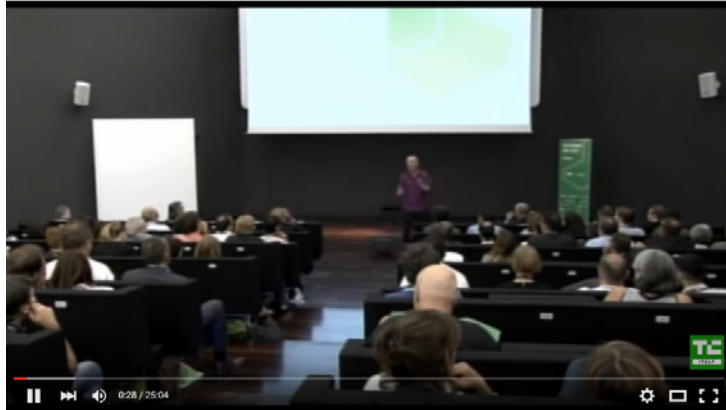
Renato Soru at TechCrunch Italy 2013