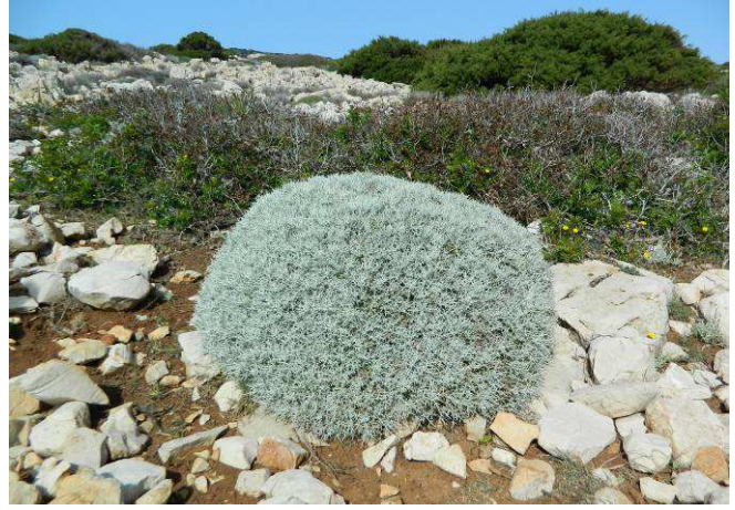
>> Centaurea horrida (endemismo)