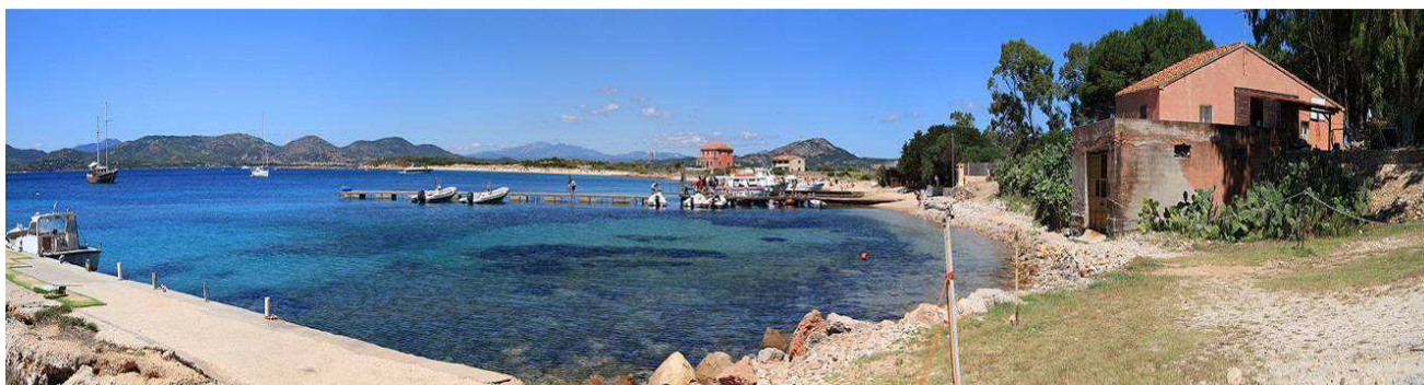
>> Zonizzazione dell'Area Marina Protetta. Il SIC coincide con il confine dell'AMP

Al minimo grado di antropizzazione dell'isola di Tavolara e di quella di Molara corrisponde un minimo livello di infrastrutturazione e la quasi totale assenza di parte di essa (ad esempio l'elettrificazione).