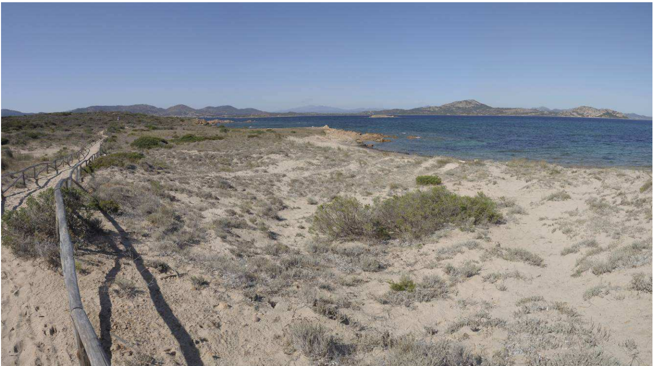
>> Habitat dunali a Spalmatore di Terra

Le tabelle nelle pagine seguenti riportano i contenuti del Formulário Standard (versione pubblicata ad ottobre 2013) e l'Aggiornamento, per la compilazione del quale sono state seguite le indicazioni contenute nelle "Note esplicative" inserite nell'Allegato alla Decisione UE 11/07/2011 n. 484 "Decisione di esecuzione della Commissione dell'11 luglio 2011 concernente un formulário informativo sui siti da inserire nella rete Natura 2000". L'aggiornamento è stato eseguito mediante analisi bibliografiche (di studi editi ed inediti), fotointerpretazione ed in particolare indagini in campo e riordino delle conoscenze e dei dati emersi nei differenti studi e monitoraggi svolti dall'AMP nel corso delle proprie attività.