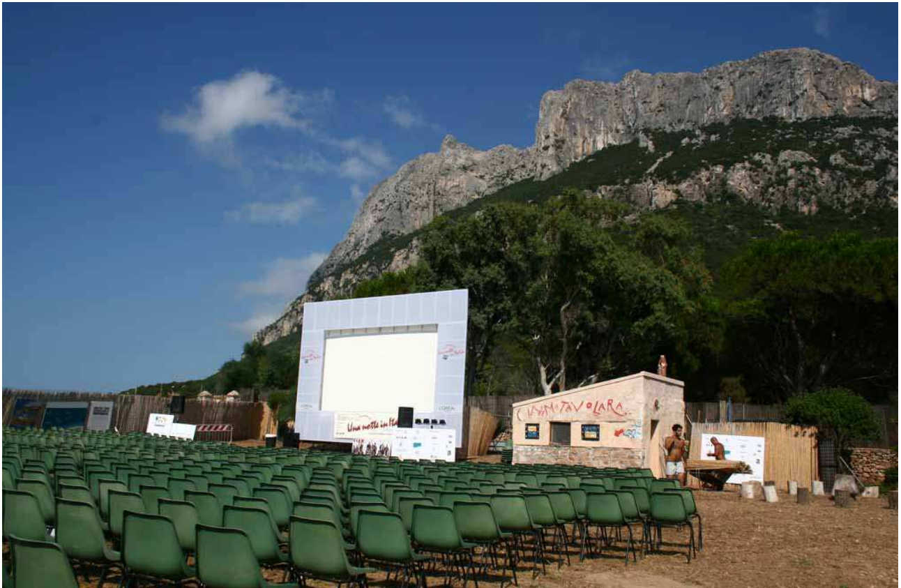
>> La platea della manifestazione “Cinema Tavolara” a Spalmatore di Terra

Alla tradizione sono legate anche le “tracce votive” come quella dell’edicola votiva bianca, eretta per la Madonna che salvò due pescatori; ma anche la Madonnina di Punta La Marmora e la stessa Punta del Papa.