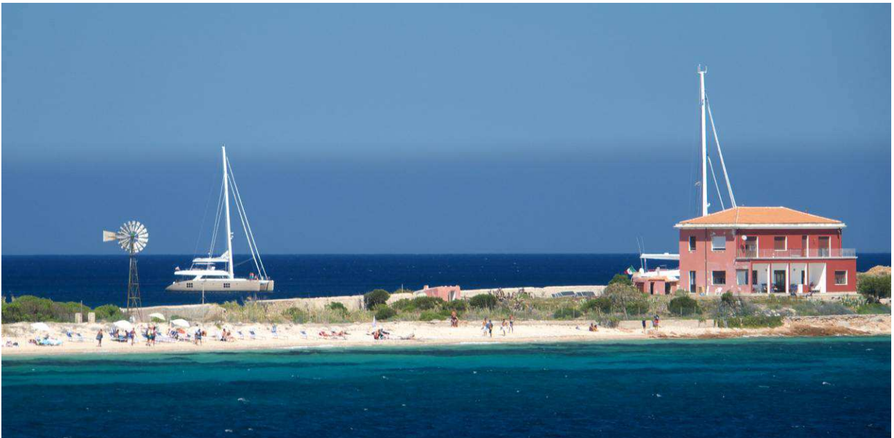
>> La spiaggia di Spalmatore di Terra con bagnanti nel periodo estivo

L'analisi economica in relazione al SIC deve porre in luce prioritariamente quei fenomeni e quelle dinamiche che possono generare più probabilmente interdipendenze ed impatti, sia auspicati che non, tra i soggetti economici e la gestione del SIC.