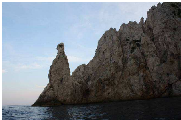
>> Le scogliere nella parte nord-est dell'Isola di Tavolara e Punta del Papa.