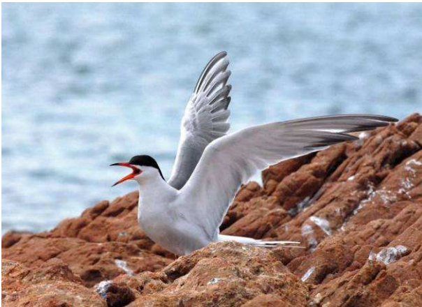
>> Sterna comune o rondine di mare (Sterna hirundo)