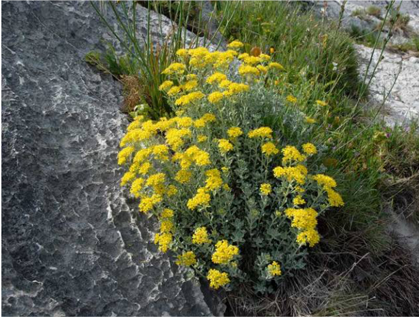
>> Alyssum tavolarae (endemismo)

Le stazioni di Centaurea horrida sono a rischio per impatto delle capre inselvatichite (calpestio, brucatura, innesco di fenomeni erosivi) e per altri fattori (presenza di inerti, erosione marina della scarpata).