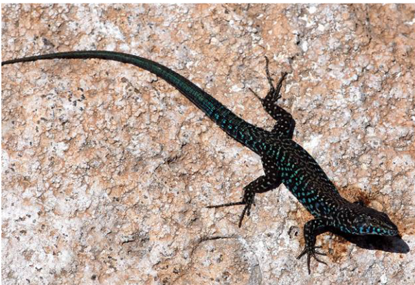
>> Lucertola tirrenica sottospecie ranzii (Podarcis tiliguerta ranzii)