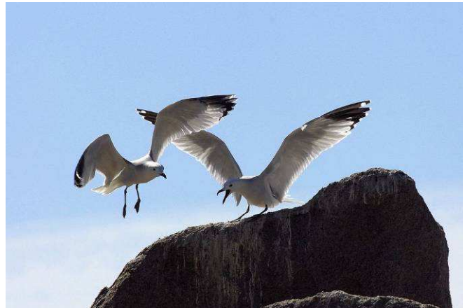
>> Gabbiani corsi (Larus audouinii)