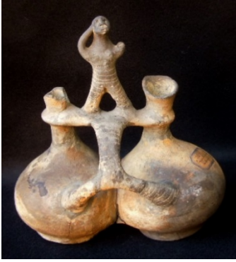
Brocchetta askoide gemina

La civiltà nuragica ebbe origine a partire dal 1800-1600 a.C. e regnò indisturbata fino al VI secolo a.C. I suoi abitanti, cosiddetti "Nuragici" erano un popolo di guerrieri, pastori e contadini, suddivisi in piccoli nuclei tribali (clan). Gli studi basati sui reperti archeologici trovati, affermano che essi fossero degli abili navigatori. Per questo motivo si spostavano facilmente in tutto il bacino del Mediterraneo, mantenendo contatti con vari popoli: micenei, cretesi, ciprioti, etruschi e iberici. Furono trovate ceramiche nuragiche risalenti all'età del bronzo a Creta, Cipro, Sicilia ecc., mentre nell'età del ferro giunsero in località quali le coste iberiche e tirreniche. Essi producevano prevalentemente vasi comuni, anforette, olle utilizzate dai marinai nuragici come ceramica di bordo. Le brocchette askoidi , rinvenute nelle tombe etrusche, contenevano vini sardi commerciati con gli etruschi nel