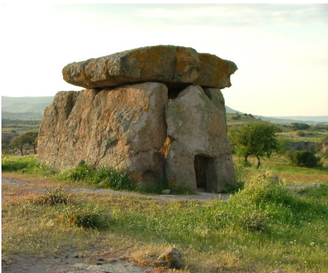
Mores, dolmen di Sa Coveccada, uno dei dolmen più grandiosi del Mediterraneo

Tra il VI e il III millennio a.C. la Sardegna visse un periodo storico chiamato " Età Prenuragica " che viene collocato all'interno della Preistoria e che vedrà un grande sviluppo culturale tra il Neolitico e l'Eneolitico (le sue due fasi finali). In questo periodo i prenuragici abitavano villaggi e grotte, vivendo di caccia, pesca, tessitura e coltivazione di cereali. Essi costruivano strumenti in selce e ossidiana, materiali di cui l'isola