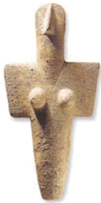
Mater Mediterranea trovata a Senorbì

testimonianze archeologiche rinvenute nel sito di Senorbì e circondario, partendo dal periodo prenuragico fino al periodo romano.