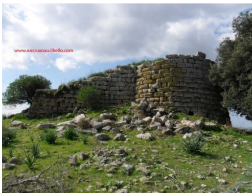
Nuraghe di Sisini

Nella Trexenta sono rimaste anche molte testimonianze della civiltà nuragica simbolo del fatto che la zona venne abitata sin dai tempi più remoti. Nel territorio di Senorbì troviamo tre nuraghi: a Sisini, sul Monte Uda e sul colle di Simieri . Il nuraghe di Sisini sorge a sud del paese e si può notare che dopo il crollo della cupola restano alti muri perimetrali formati da poderosi massi coperti di lichene rossiccio. Esso resta in vista degli altri nuraghi della zona e sicuramente faceva parte dei sistemi di avvistamento e di difesa presenti anche sui monti circostanti di Siurgus e San Basilio. Di planimetria anomala, è costruito secondo lo schema dei templi a pozzo, con atrio rettangolare antistante alla camera circolare del pozzo. Purtroppo lo stato di abbandono del sito e il suo mancato studio non permette di svelare molti dei dubbi che permangono riguardo la funzione di questo sito.