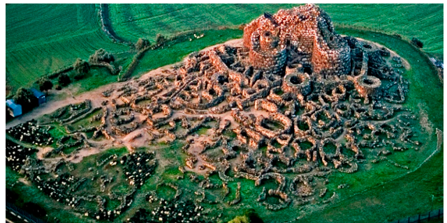
Nuraghe di Barumini

Mediterraneo orientale. La civiltà nuragica prende tale nome dalle costruzioni che tale popolo era solito erigere: i nuraghi . Questi erano delle torri tronco-coniche in pietra che deriverebbero dall'evoluzione delle capanne neolitiche che nel tempo subirono sostanziali mutamenti. I nuraghi potevano essere di vario tipo: quelli più semplici (detti monotorre) risalgono al periodo tra il 1800 e il 1700 a.C. e